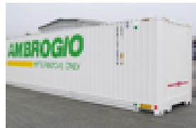
Box Container AMBROGIO